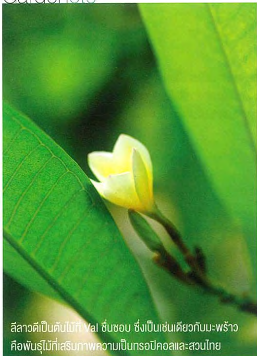
สีลาวตีเป็นต้นไม้ที่ Val ชื่นชอบ ซึ่งเป็นเช่นเดียวกับมะพร้าว คือพันธุ์ไม้ที่เสริมสภาพความเป็นทรอปิคอลและสวนไทย