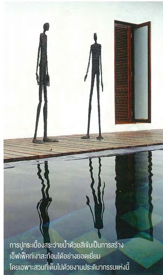
การบูรณะห้องสระด้วยน้ำด้วยสีเข้มเป็นการสร้าง เอฟเฟ็กต์เงาสระก่อนได้อย่างยอดเยี่ยม โดยเฉพาะสวนที่เต็มไปด้วยงานประติมากรรมแห่งนี้