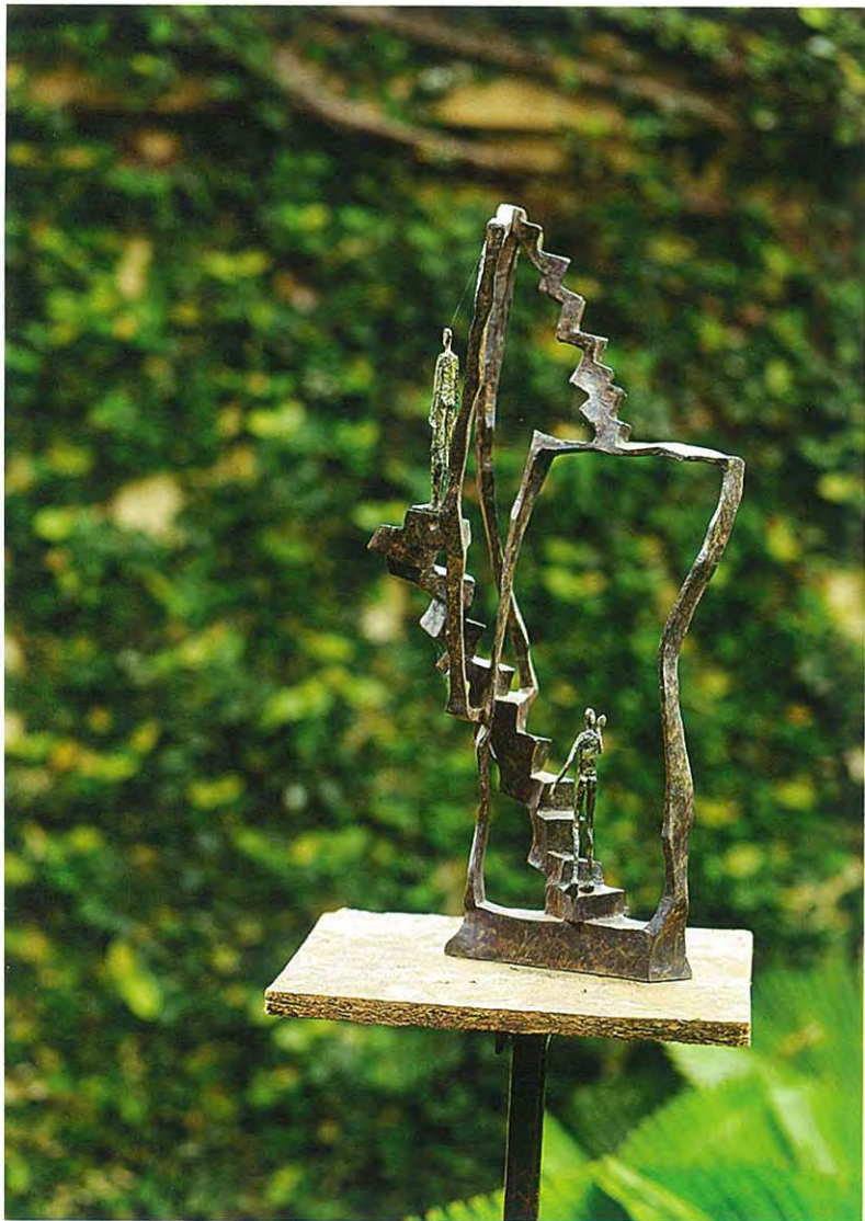
การใช้ไม้พุ่มสูงเป็นฉากหลัง ก็สามารถจับภาพประติมากรรมให้สวยได้

หน้าต่างบานเพี้ยม และประตูใหญ่เปิดโล่งเห็นต้นไม้เขียวที่เพิ่งได้รับฝน ไปหมาดๆ ผลงานประติมากรรมสำริดของเธอประดับเรียงรายอยู่ทั่วไป ช่วยสื่อถึงความหมายของพื้นที่ได้อย่างดีเยี่ยม “เราไม่ต้องเสียเวลาดูแล รูปปั้นเหล่านี้เลย เพราะมันทำมาจากสำริด ซึ่งเมื่อเวลาผ่านไปแดด ลม ฝน ก็จะทำให้มันมีสนิมสีเขียวขึ้น สร้างเสน่ห์อีกแบบให้กับชิ้นงาน” เธอกล่าว และเป็นจริงอย่างที่ว่า เพราะสนิมสีเขียวนอกจากสร้างความสวยงามให้แก่ รูปปั้นแล้วยังทำให้มันดูกลมกลืนและไม่แข็งกร้าวเมื่ออยู่ร่วมกับต้นไม้ ผลงานของวาลกล่าวถึง ‘สัมพันธ์ภาพระหว่างมนุษย์กับธรรมชาติ’ และเธอ ก็ทำให้เห็นว่าสองสิ่งนี้สามารถอยู่ด้วยกันได้อย่างไม่ขัดเคืองด้วยผลงาน ของเธอกับสวนแห่งนี้