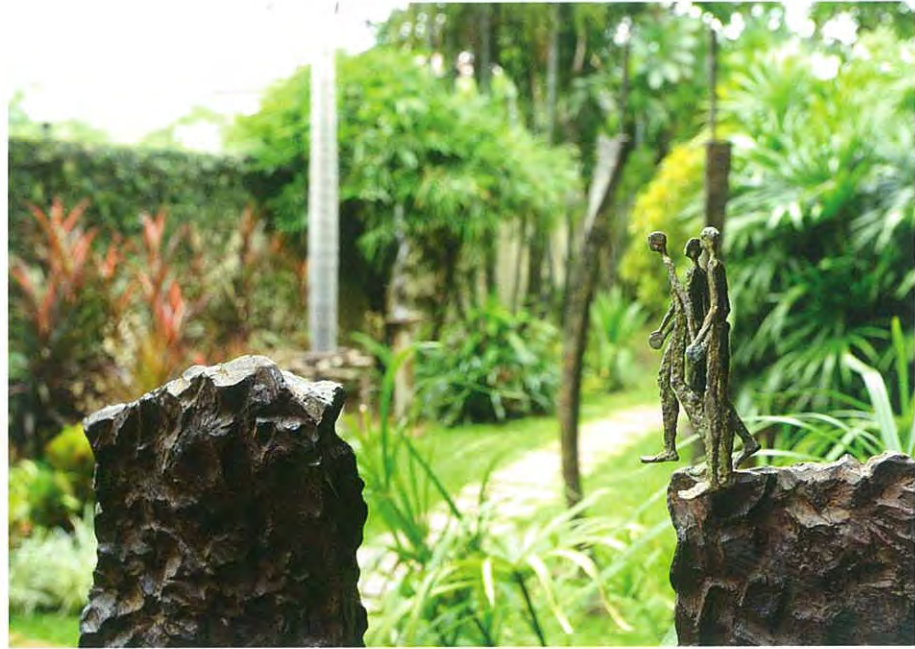
งานจากมือมนุษย์กับความเป็นธรรมชาติ สามารถสร้างความกลมกลืนได้ด้วยการ 'ปล่อยให้ตามกาลเวลา' เช่นการปล่อยให้เกิดคราบสนิม ปล่อยให้ตะไคร่สีเขียวขึ้นเกาะ ความไม่สมบูรณ์แบบนี้เองที่เป็นเรื่องธรรมชาติ