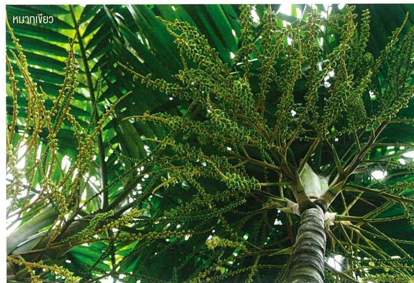
หมากเงี้ยว