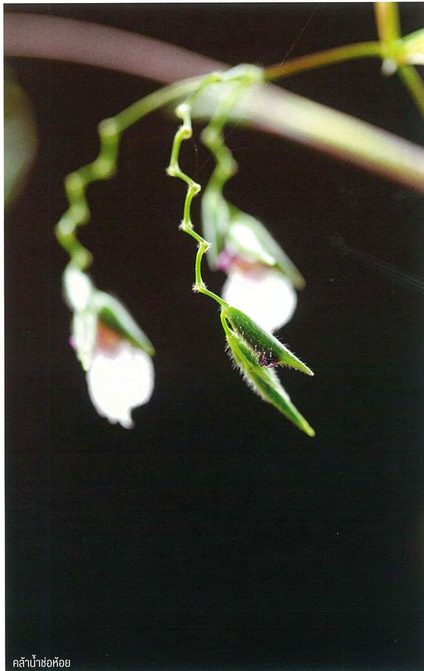
คล้าน้ำช่อห้อย